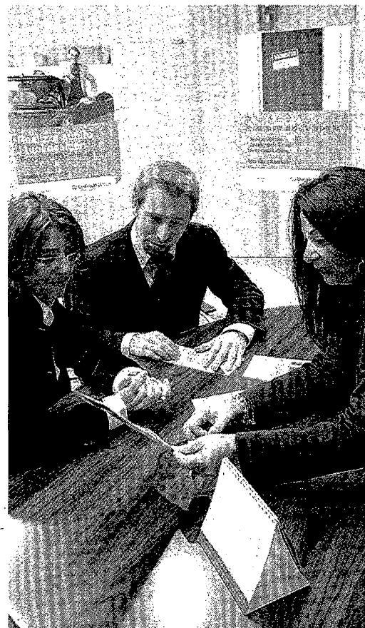
Il nuovo modello sarà testato su tre banche dati differenti: una è a Singapore